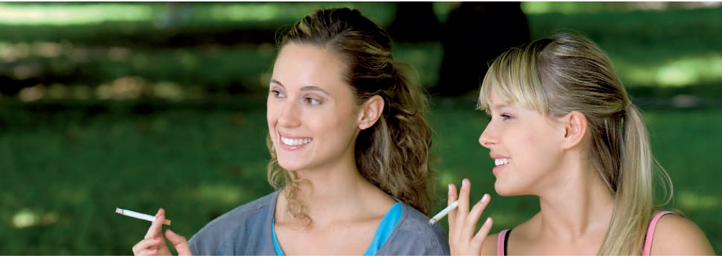
Auch übermäßiger Tabakkonsum kann zu kleinen CO-Vergiftungen führen!

Fatal, wenn man bedenkt, dass viele Eltern ihren Kindern das Rauchen der Shisha erlauben in dem Irrglauben, sie wäre gesünder als die gemeine Zigarette.