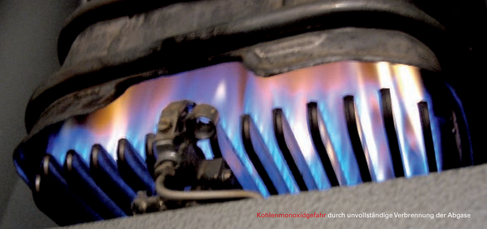
Kohlenmonoxidgefahr durch unvollständige Verbrennung der Abgase